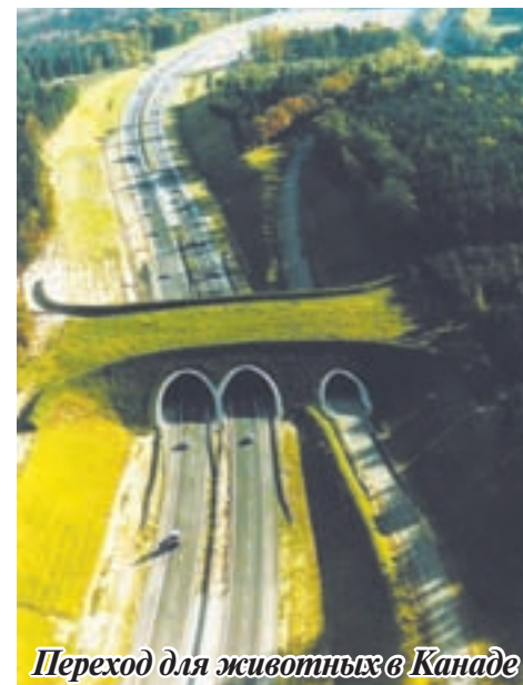
Переход для животных в Канаде