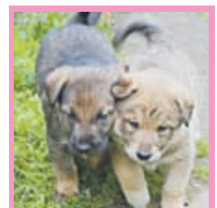
• ОТДАМ ЩЕНЯТ в хорошие руки. Т. 8-963-603-23-43.